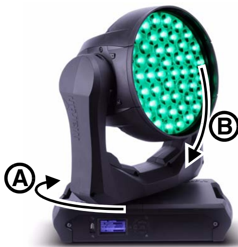
Figure 3: Etalonnage du pan et du tilt